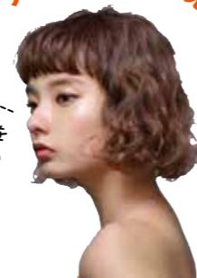
5Gトリートメントさん