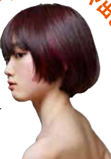
アシドリビジョンさん