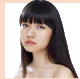
アシッドストレートさん