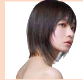
LGアシッド&スパイスAさん