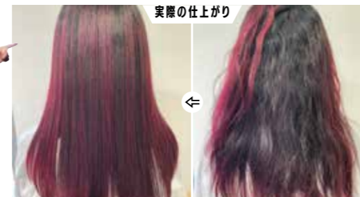
実際の仕上がり ブリーチ履歴があり、内部に強いうねりがある髪。「LGアシッド」と「スパイスA」を使用して、髪を補修しながらクセにもアプローチした。