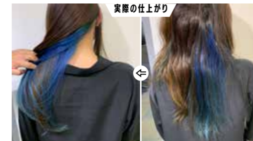
実際の仕上がり インナーに、19Lvのホワイトブリーチの上に塩基性カラーの履歴あり。ごわつきやクセが気になる髪質だったが、ダメージを感じさせないツヤ質感のストレートに。